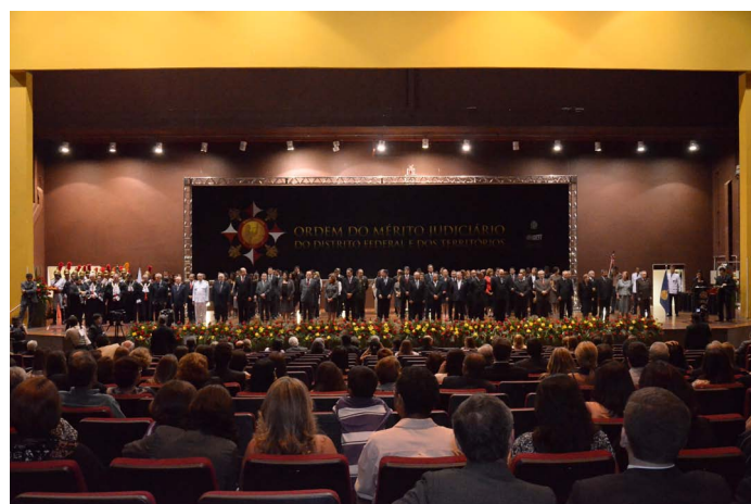
8ª edição da entrega da Ordem do Mérito Judiciário do Distrito Federal e dos Territórios, realizada em 2012.

Caso deseje conhecer mais sobre a Ordem do Mérito Judiciário do Distrito Federal e dos Territórios clique aqui e acesse a Portaria GPR nº 210, de 5 de março de 2010, que publicou a Resolução nº 10/99, e suas alterações posteriores.