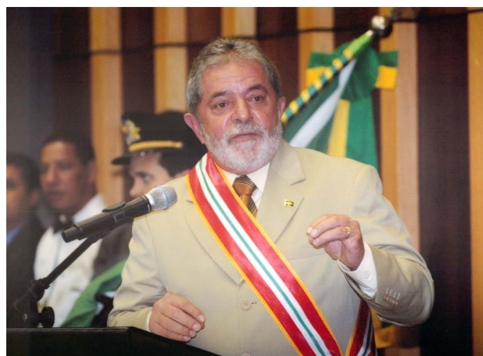
O então Presidente da República Luís Inácio Lula da Silva foi agraciado com a OMJDFT em 2009.