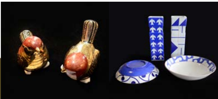
à direita Congresso (porcelanas, conjunto com 4 peças) Vique - Ateliê Bell Stipp – 120 Anos do Tratado de Amizade Brasil-Japão (28/9 a 9/10/2015)