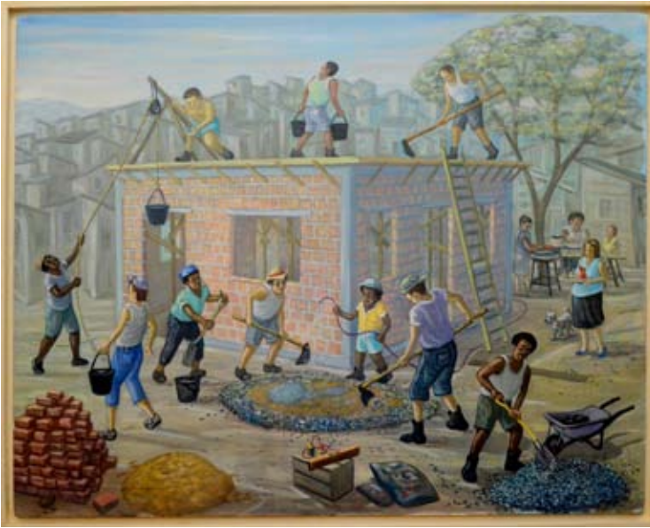
Mutirão (óleo sobre tela, 54 x 65cm) Sérgio Vidal – Crônicas do Cotidiano (9 a 20/11/2015)