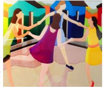
Ciranda com Meninas (fabric collage, 36 x 48cm) Marília Ferrer – Tecidos na Infância (19 a 30/10/2015)