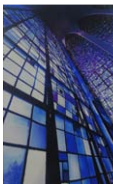
Brasília (fotografia, 40 x 30cm) Martim Garcia Arquitetura e Patrimônio Mundial Exposição Coletiva (15 a 26/6/2015)