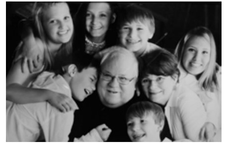
Promessa Chão (fotografia, 40 x 60 cm) Alliny Nunes Entre Afetos e Sombras (6 a 17/7/2015)