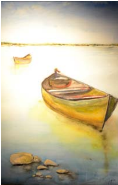
Waiting for the Owner (aquarela, 36,5 x 54cm) Jorge Blues – Na Cidade e no Campo (15 a 26/6/2015)