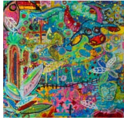
Bumba Meu Boi (acrílico e giz sobre tela, 80 x 80cm) Ricco – Amor Colorido (8 a 18/9/2015)