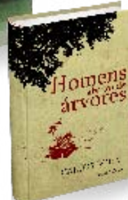
"Homens Abaixo de Árvores" (Chiado Editora) Carlos Böhm Livro lançado em 5/8/2015.