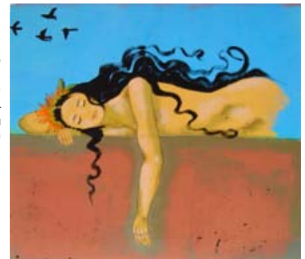
Ronda (acrílico sobre tela, 83 x 96cm) Mirele Brant – Percalços (25/5 a 9/6/2015)